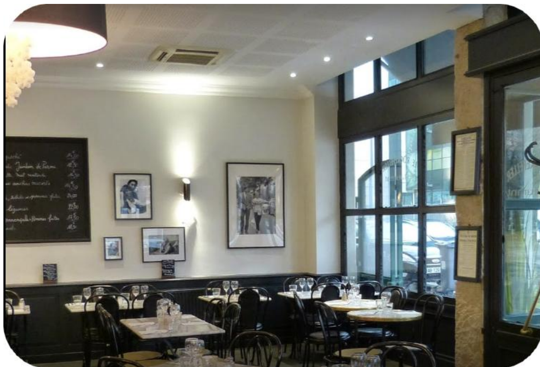
Restaurant Le Rockefeller 61 Avenue Rockefeller, 69003 Lyon