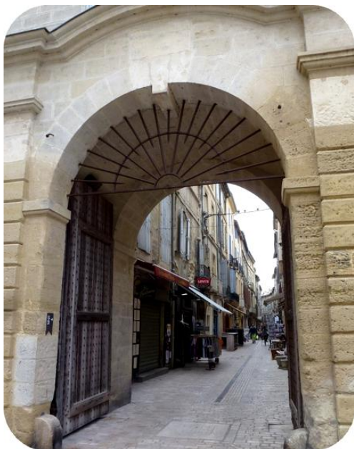
Autre vestige médiéval La porte du Bourguet

La Tour de l'Horloge fut inscrite à l'Inventaire des Monuments Historiques le 4 avril 1926.