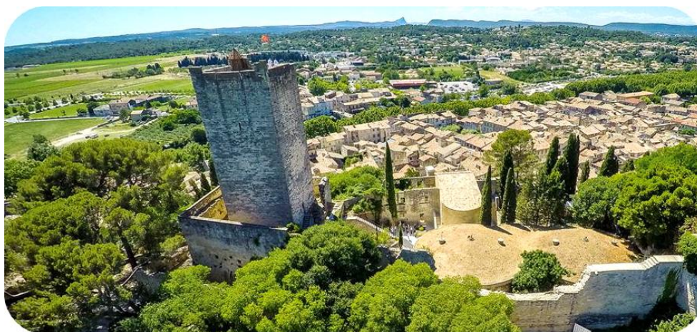
Le Château de Sommières

Plusieurs fois restauré, les travaux les plus importants datent de 1716. On a du mal aujourd'hui à reconnaître la construction antique, du moins dans la partie dominant le fleuve. En revanche, l'arche visible Rue de la Grave a été conservée dans son état d'origine. Les autres ont servi longtemps de maisons au confort minimum pour finir en caves, ateliers ou garages. Depuis qu'une partie de la ville a été classée secteur sauvegardé, elle a mis en place une politique de conservation et de restauration du patrimoine.