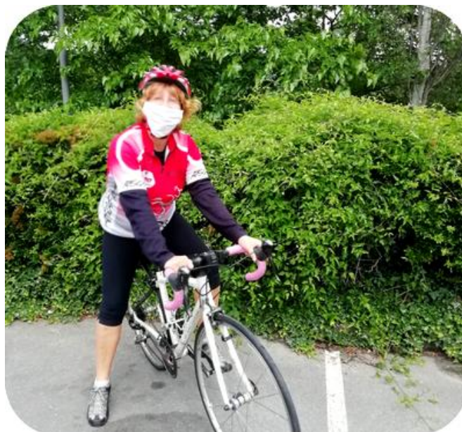
Les cyclotes masquées

Mardi 12 Mai, sortie sur la via Rhôna, pour retrouver le plaisir de rouler ensemble, se revoir, et vérifier notre équilibre et état des muscles.