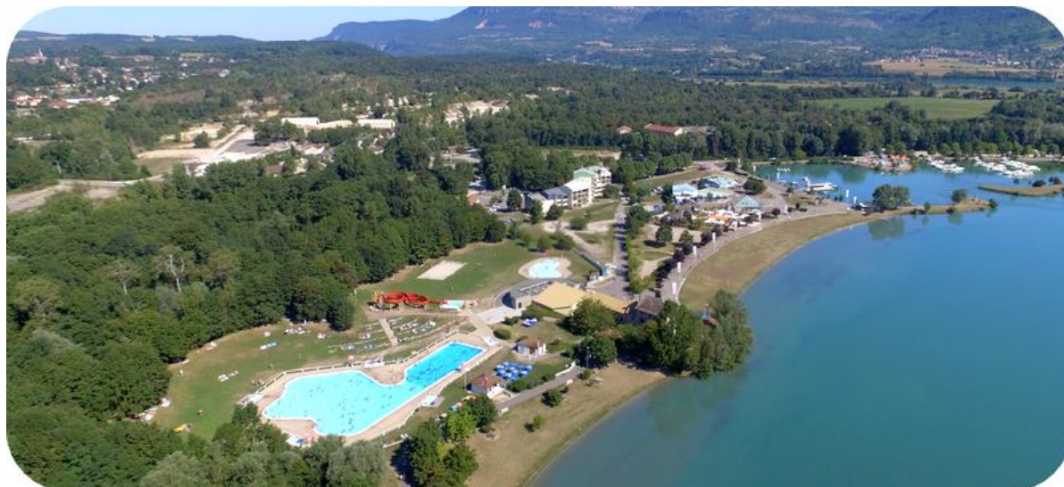
La vallée bleue