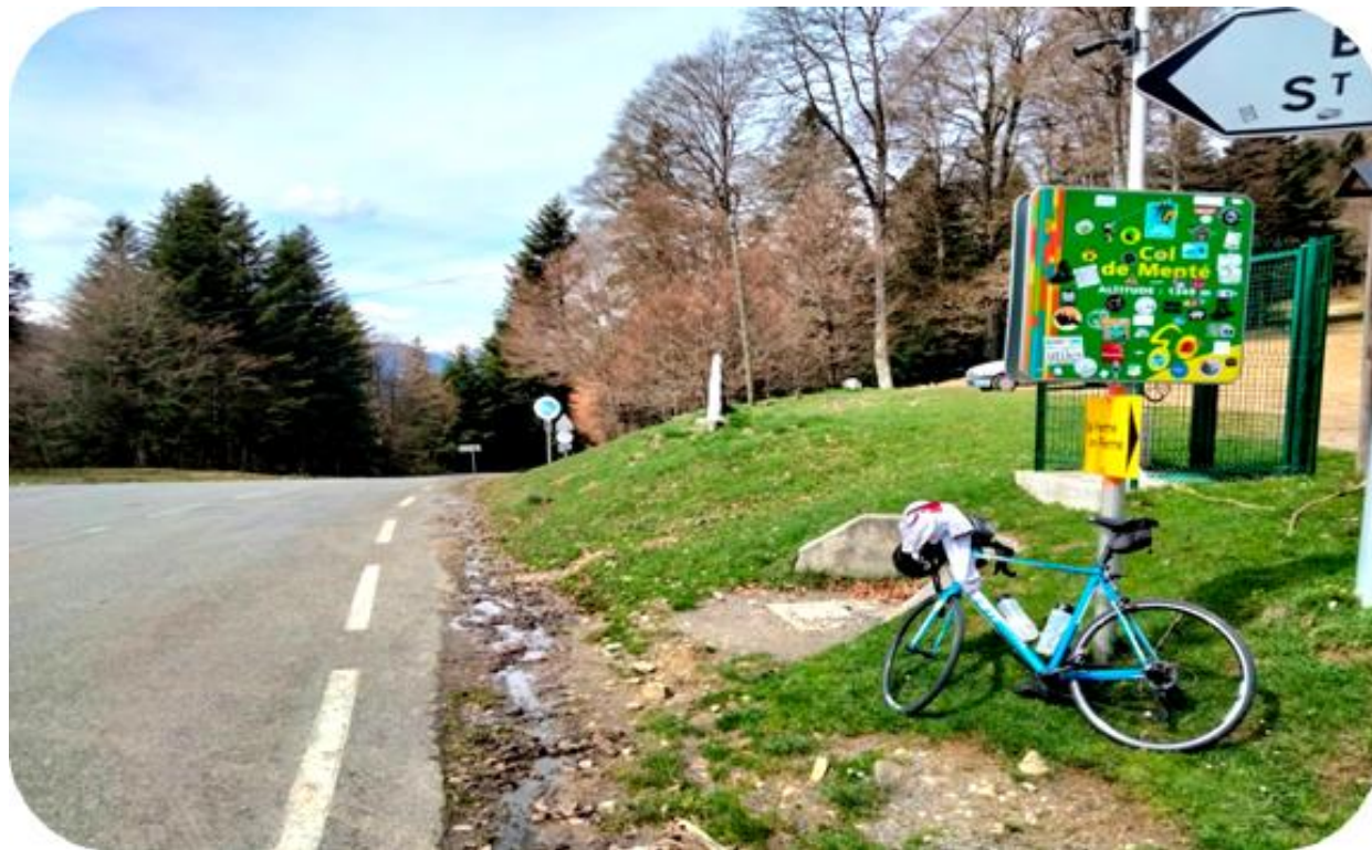
Col de Menté

J'arrive donc au col de Houtarède puis celui de Mountmédan et il est temps de revenir sur Aspet bien fatigué mais heureux du parcours accompli avec ses 83 bornes et ses 1600m de D+.