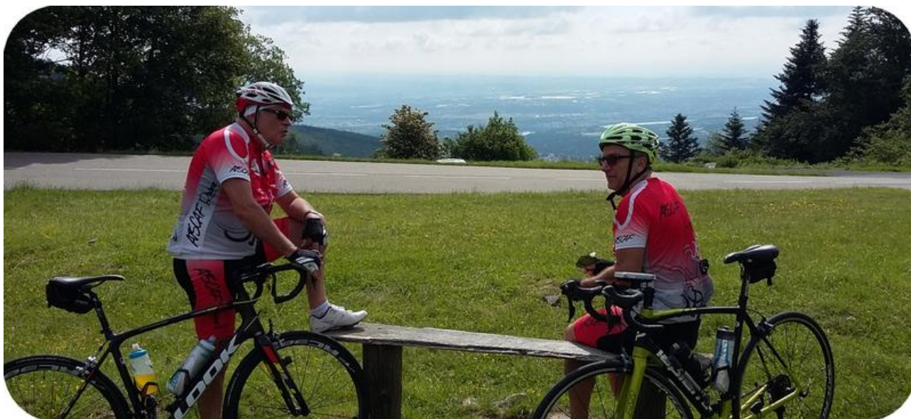
Croix du Collet

Pas trop dans mon assiette, j'avance encore moins vite que d'habitude. Les copains m'attendent régulièrement. Je me fais doubler par des cohortes de cyclos, tous plus fringants les uns que les autres. Mais, quand même, je réussis à en doubler un. Si, si, il est encore plus mal que moi et s'arrête régulièrement. Je le double, il repart, me redouble pour s'arrêter plus loin.