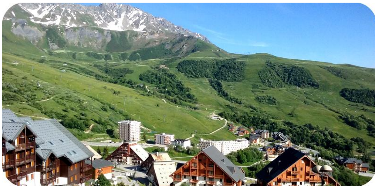
Vue de St François Longchamp depuis les chambres de l'hôtel