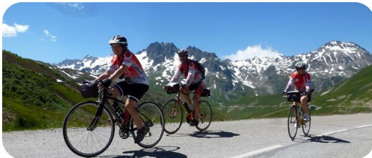
Entre le Glandon et la Croix de Fer

Tout le monde arrive au sommet. Mais ce n'est pas fini.