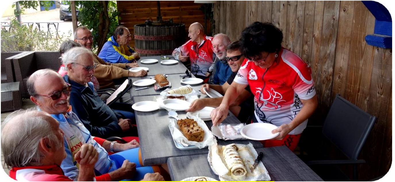
Le banquet final de la saison 2022