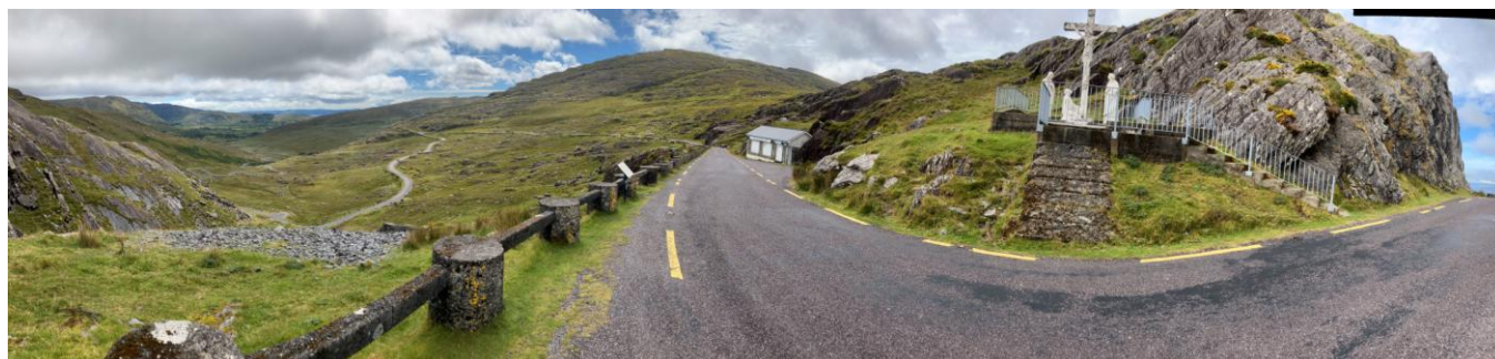
Panorama au sommet de Healy Pass

Cette montée n'est pas la plus difficile que nous ayons eu à affronter. Je fais une pause au sommet pour profiter des paysages. Nos heures sous la pluie sont récompensées par ce point de vue.