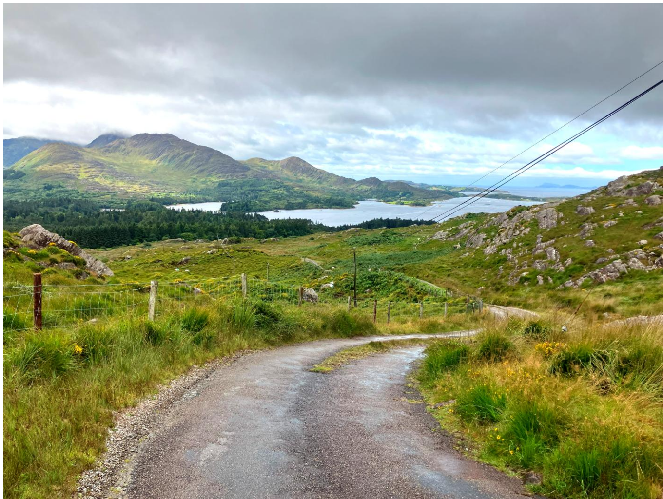
Dans la montée du Healy Pass

Cette montée n'est pas la plus difficile que nous ayons eu à affronter. Je fais une pause au sommet pour profiter des paysages. Nos heures sous la pluie sont récompensées par ce point de vue.