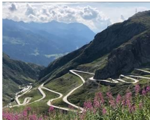
Gotthard Pass et les lacets de la Trémola

Association Touristique Sportive et Culturelle des Administrations Financières. Courriel cyclo.atscaf69@gmail.com Site https://atscaf69.sportsregions.fr/