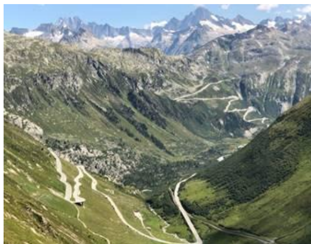
Furkapass (2434 m) descente du Furkapass et en face la montée du Grimsel