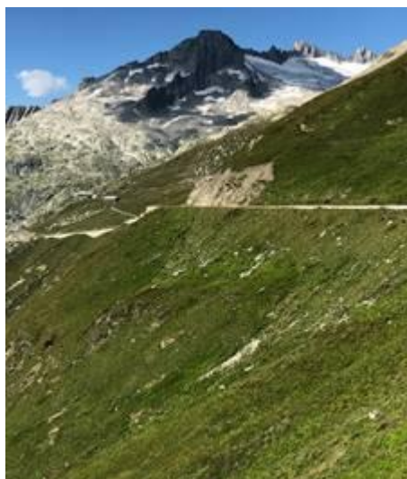
Glacier au Furkapass