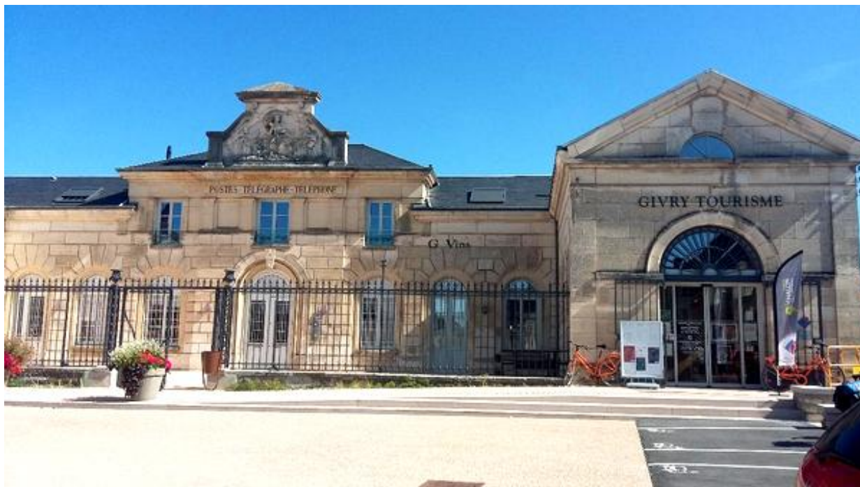
GIVRY, l'ancienne halle