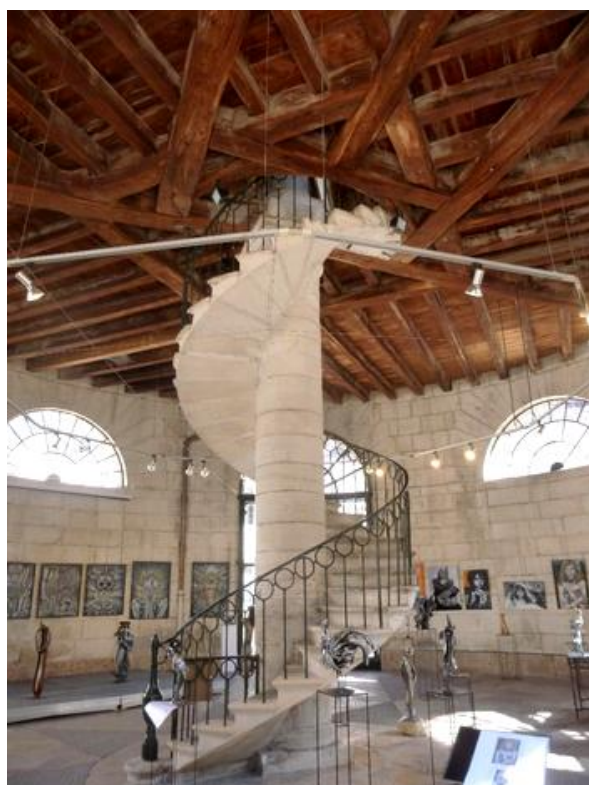
GIVRY, l'ancienne halle