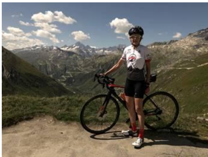
Et moi, et moi .... J'y étais aussi !

Pour celles et ceux qui aiment la montagne, (vélo et/ou randonnée, pas mal aussi en moto) c'est vraiment un super endroit !