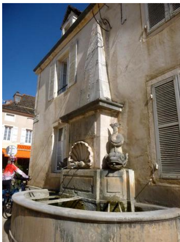
GIVRY, fontaine aux dauphins

Association Touristique Sportive et Culturelle des Administrations Financières. Courriel cyclo.atscaf69@gmail.com Site https://atscaf69.sportsregions.fr/