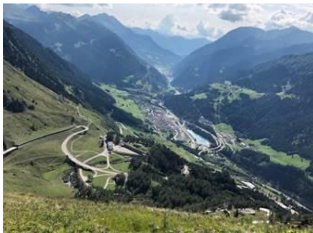
Vue au Gotthard Pass

Voici quelques photos pour vous convaincre et rappeler des souvenirs à certains !!