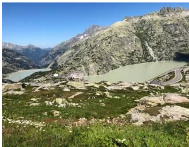
Grimselpass (2160 m) et ses lacs