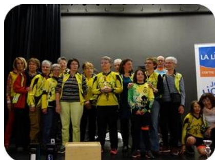
Coupe des féminines CHASSIEU