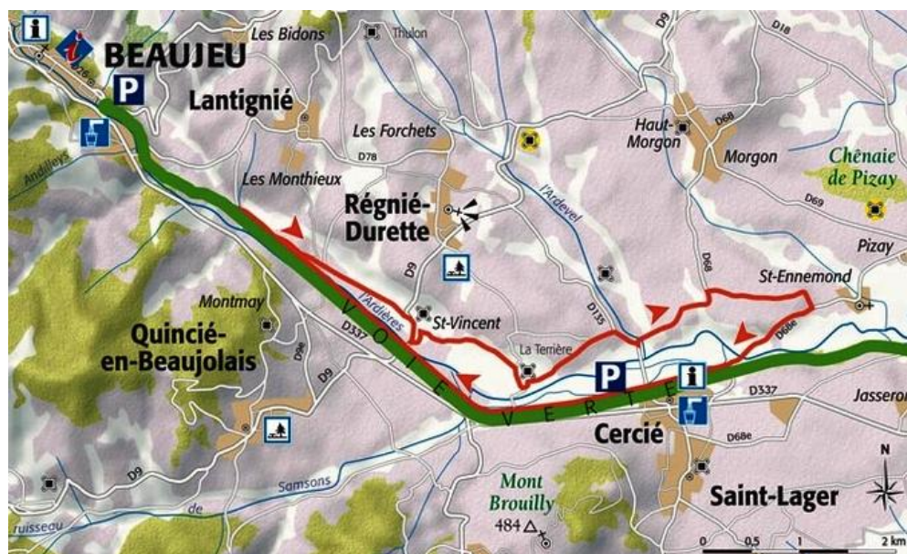
Chemin des Muriers

Association Touristique Sportive et Culturelle des Administrations Financières. Courriel cyclo.atscaf69@gmail.com Site https://atscaf69.sportsregions.fr/