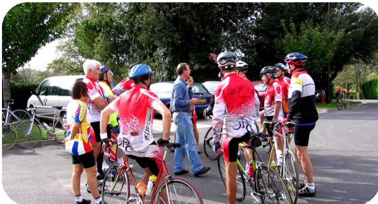
Le tirage au sort des équipes