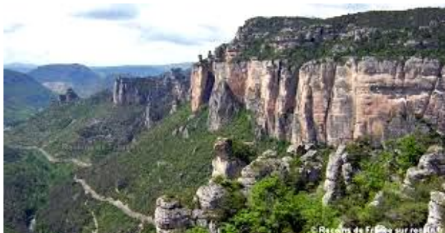
GORGES DE LA JONTE

Nous n'aurons juste pas assez de temps, il nous faudra revenir.