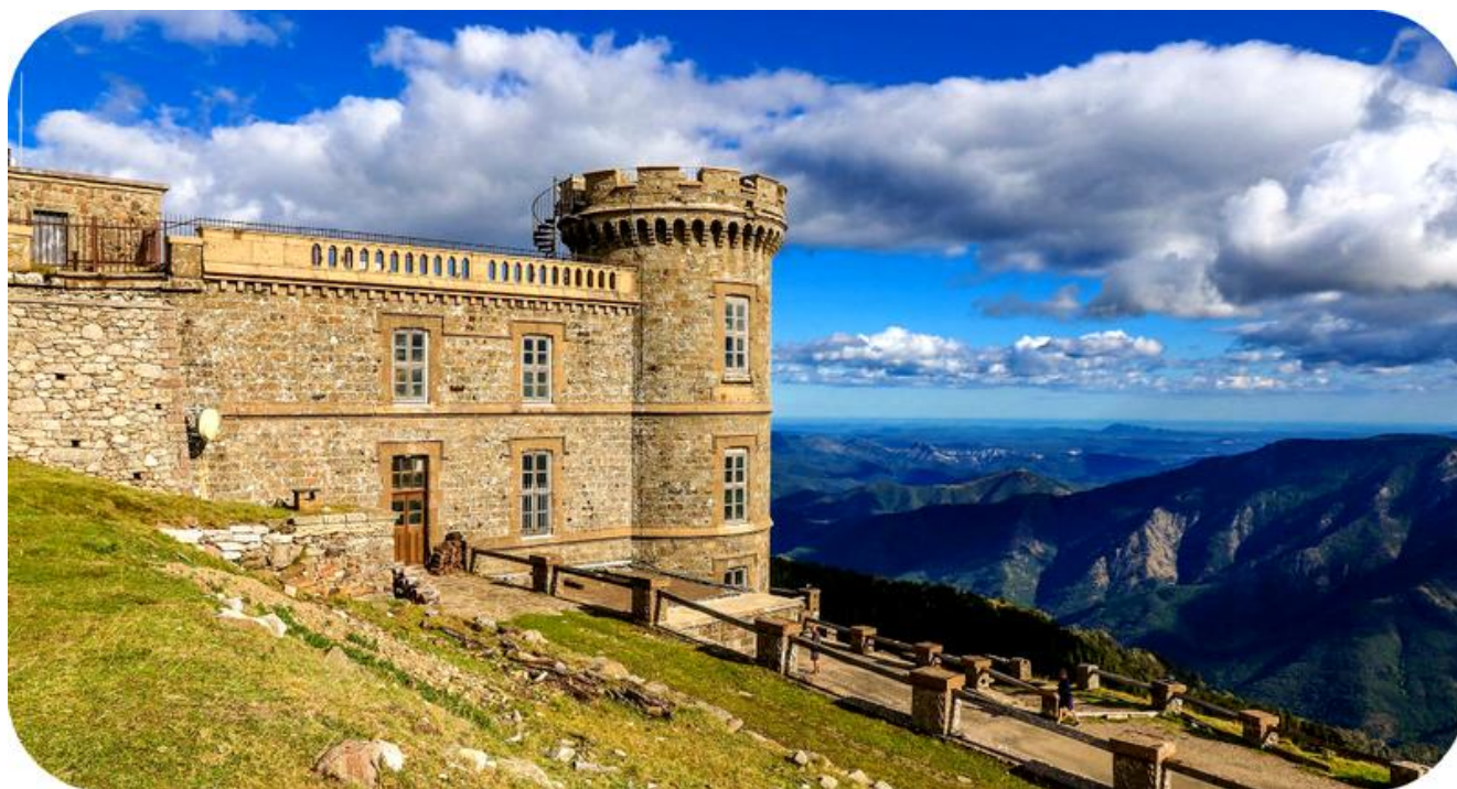
LE MONT AIGOUAL

Pour ce qui nous concerne nous allons entre autres activités, grimper jusqu'au Mont AIGOUAL , le Seigneur des Cévennes.