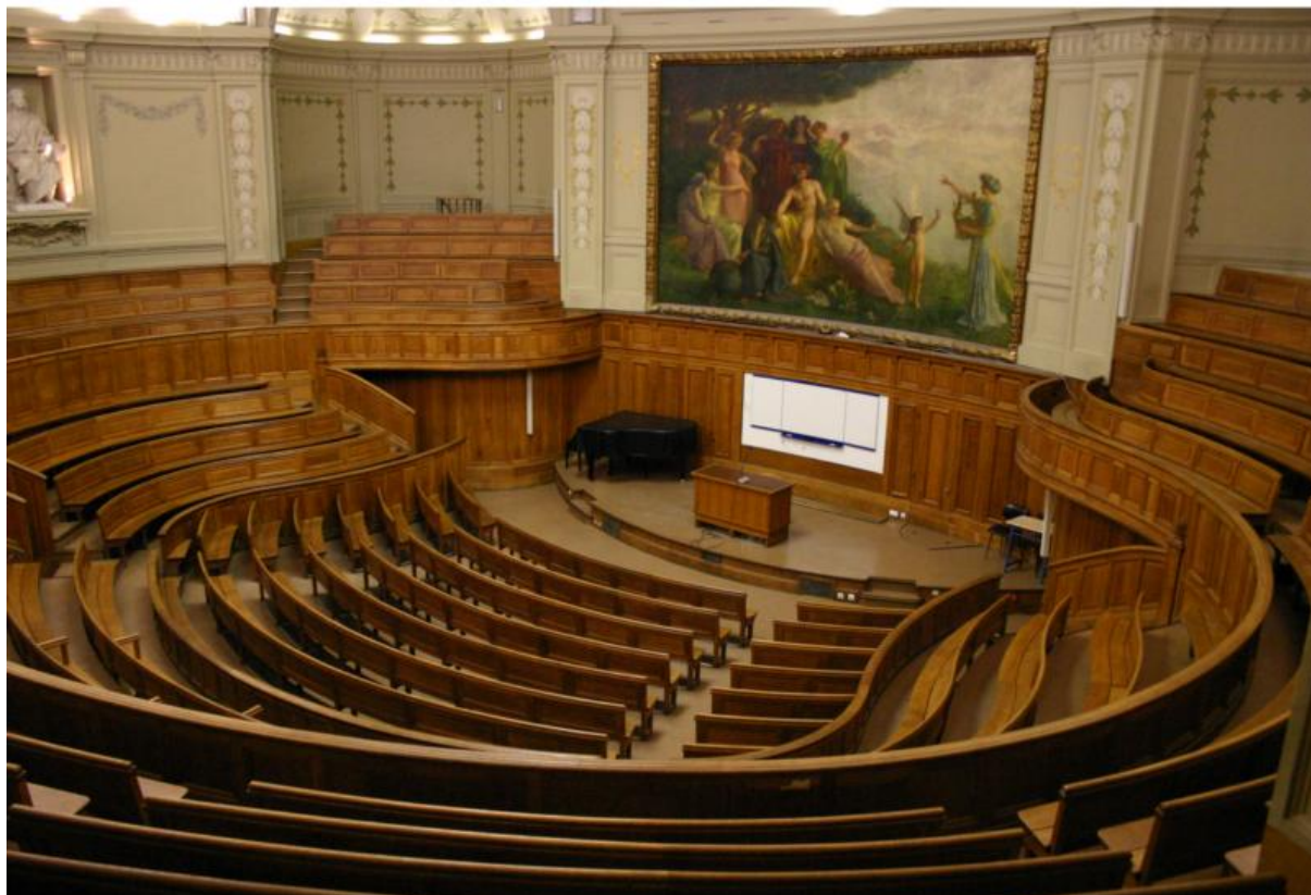
Amphithéâtre Richelieu à la SORBONNE

Notre Assemblée Générale 2020 se tiendra samedi à Bron.