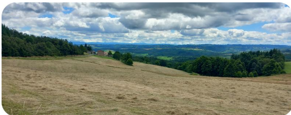
La route des balcons du Forez

D'après les « 100 cols » celui-ci se trouvait à une centaine de mètres de la grande route sur une petite vicinale. Or la pancarte se trouve sur la route. Sans doute un col glissant. Quoiqu'il en soit nous faisons le détour pour être sûrs de le conquérir. Nous longeons donc un pré où des chèvres naines d'en donnent à cœur joie ainsi que des ..... lapins ? Non trop gros pour des lapins ! En s'approchant on s'aperçoit qu'il s'agit de wallabys. Curieux ! Mais après tout, il y a bien des lamas au Tourmalet, pourquoi pas des wallabys au Pichillon ? Il faut s'habituer au réchauffement climatique ! Ils voisinent avec de magnifiques paons blancs. Si on ajoute les chiens -bruyants-, les poules et autres gallinacées, c'est une vraie arche de Noé.